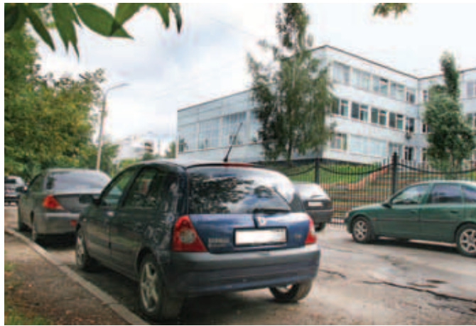
Подъездная «дорога» к Дмитровской школе № 1.

В ПРЕДВЕРИИ НАЧАЛА УЧЕБНОГО ГОДА И В РАЗГАР ПОДГОТОВКИ К ОСЕННЕ-ЗИМНЕМУ ПЕРИОДУ В АДМИНИСТРАЦИИ ДМИТРОВСКОГО МУНИЦИПАЛЬНОГО РАЙОНА СОСТОЯЛОСЬ ЗАСЕДАНИЕ ОБЪЕДИНЕННОЙ КОМИССИИ ПО ОБЕСПЕЧЕНИЮ БЕЗОПАСНОСТИ ДОРОЖНОГО ДВИЖЕНИЯ.