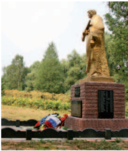
Так выглядела территория, заросшая борщевиком, возле памятника воинам, 23 июля 2010 года в п. Горшково.

– уксусом натрия на пихтовом базисе; – линиментом синтомицина. Не применяйте никакие фиксирующие повязки. Проводите все мероприятия, традиционно назначаемые при ожогах кожи.