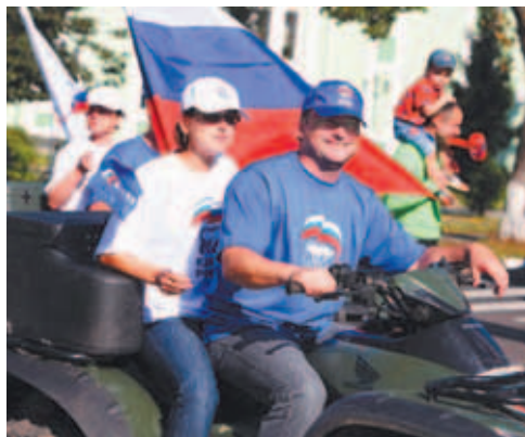
Окончание. Начало на 9-10 стр.

Немаловажно и развитие системы дошкольного образования. За последние годы на территории района резко увеличилась рождаемость, что свидетельствует об улучшении благосостояния жителей района. Однако с увеличением рождаемости появились и новые проблемы, а именно недостаток детских садов и квалифицированных работников системы дошкольного образования. Для преодоления этой проблемы необходимо: