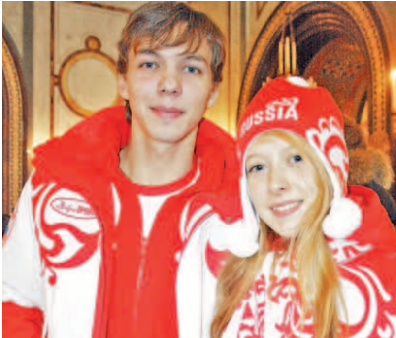
Фигуристы Екатерина Боброва и Дмитрий Соловьёв.

28 ЯНВАРЯ В МОСКВЕ СОСТОЯЛИСЬ ПРОВОДЫ РОССИЙСКОЙ СБОРНОЙ НА ОЛИМПИАДУ В ВАНКУВЕРЕ. ТОРЖЕСТВЕННАЯ ЦЕРЕМОНИЯ ВПЕРВЫЕ СОСТОЯЛАСЬ В ХРАМЕ ХРИСТА СПАСИТЕЛЯ. СО СЛОВОМ НАПУТСТВИЯ К СПОРТСМЕНАМ ОБРАТИЛСЯ СВЯТЕЙШИЙ ПАТРИАРХ МОСКОВСКИЙ И ВСЕЯ РУСИ КИРИЛЛ