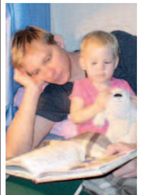
Полосу подготовила Антонина Баршева.

Тихо-тихо-тихо-тихо, В наши двери входит Тихон, Не дукает, не качает, А баюкает и качает. Тихон песенку поёт, Сны ребятам раздаёт: «В этом сне - воздушный шарик, В этом сне - собака Шарик, В этом — голуби летят, В этом — дети спать хотят». Тихо-тихо-тихо-тихо, Сумрак, дрема и покой. Дети спят. Уходит Тихон В тихий домик за рекой.