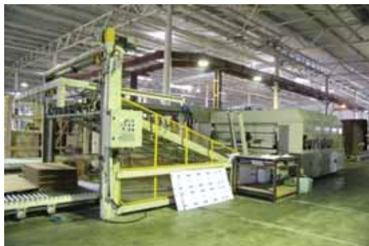
Окончание. Начало на 2-й стр.

– Сырьё каких производителей вы используете? – Мы поддерживаем российских производителей. Сырьё, которое мы используем в производстве, соответствует санитарным нормам, государственным и международным стандартам. А сотрудничаем мы с целлюлозно-бумажными комбинатами из Братска, Архангельска, Сыктывкара и другими. – Расширяться не собираетесь? – В ближайшее время мы не планируем расширение про-