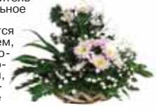
Коллектив ЗАО «Файнд-К», г. Санкт-Петербург.

Со стороны ЗАО «Файнд-К» хочется поздравить Вас с 15-летним юбилеем, желая дальнейших успехов и процветания Вашей компании и её сотрудникам. Мы искренне надеемся, что наше взаимовыгодное сотрудничество будет продолжаться ещё долгие годы.