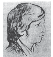
В. Васнецов. Портрет Александра Михайло- вича (1860-1927).