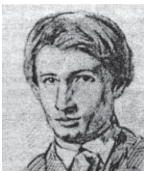
В. Васнецов. Автопортрет (1848-1926).