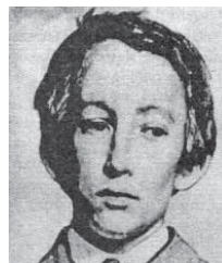
В. Васнецов. Портрет Аполлинария Михайло- вича (1856-1933).