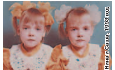
Нина и Саша, 1993 год