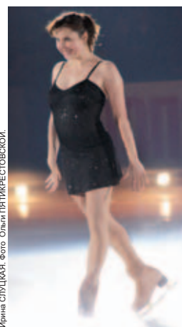
Ирина СЛУЦКАЯ

Мы надеемся, что через несколько лет это будет главная премия фигурного катания. Второй год подряд мы собираем аншлаг, - сказал чемпион мира Илья Авербух. - Зрители приходят к нам, и сегодня они вновь увидят всех олимпийских чемпионов, лидеров нашей команды. Надеюсь, что получить премию «Хрустальный лёд» будет так же почетно, как и медаль на чемпионатах Европы и мира.