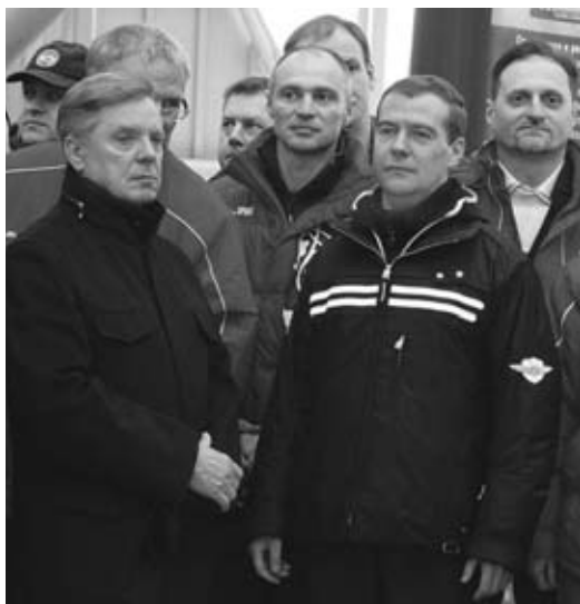
На открытии санно-бобслейной трассы.

Коренной модернизации требует и система физического воспитания в образовательных учреждениях. По статистике, 80 процентов наших школьников ведут малоподвижный образ жизни: сидят в классах, а потом дома у компьютеров. Они, к сожалению, мало посещают спортивные секции. Зачастую в ряде школ, не везде конечно, и уроки физкультуры проходят