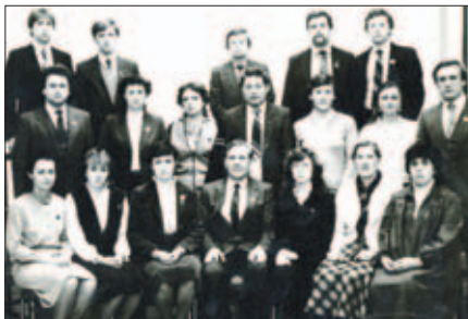
XXVII конференция Московской областной организации ВЛКСМ. Москва, 1985 г.