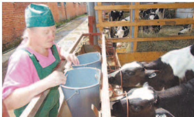
В «Кленово-Чегодаево» активно переходят на новые технологии содержания животных.