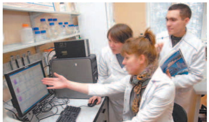
На предприятии есть своя микробиологическая лаборатория, в которой постоянно осуществляется контроль за качеством молока.

Экспериментальное хозяйство «Кленово-Чегодаево» за свои достижения в развитии молочного скотоводства неоднократно отмечалось дипломами и медалями. Животные хозяйства – постоянные участники областных, всероссийских и международных выставок племенного скота и тоже приезжают домой с медалями.