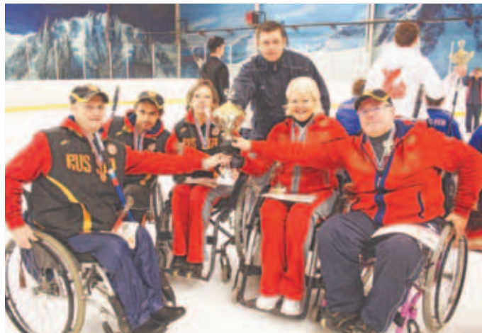
Победители соревнований – команда «Родник».

Полгода занимаюсь керлингом и первый раз участвую в таких крупных соревнованиях. У нас правила адаптированы под коляски. Бросок совершаем с помощью, скажем так, специальной палочки – экстен-