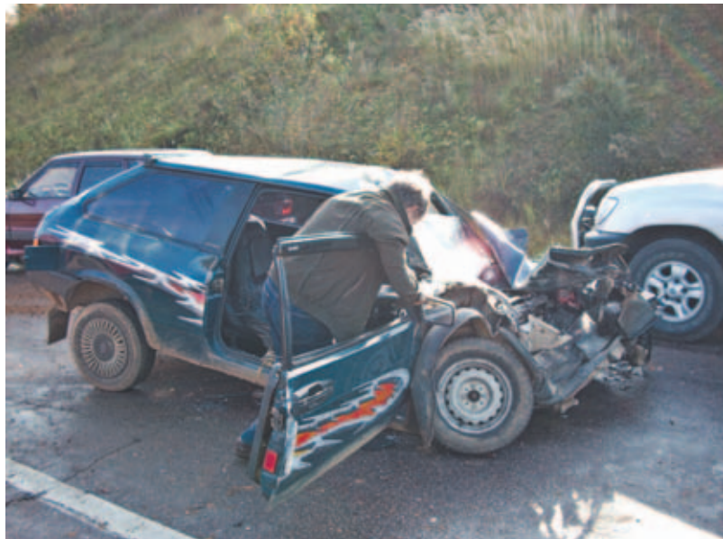
ЗА 9 МЕСЯЦЕВ ЭТОГО ГОДА НА ТЕРРИТОРИИ, ОБСЛУЖИВАЕМОЙ РАЙОННЫМ ОТДЕЛОМ ГИБДД, ЗАРЕГИСТРИРОВАНО 120 ДОРОЖНО-ТРАНСПОРТНЫХ ПРОИСШЕСТВИЙ, В КОТОРЫХ 24 ЧЕЛОВЕКА ПОГИБЛИ И 149 – ПОЛУЧИЛИ ТРАВМЫ РАЗЛИЧНОЙ СТЕПЕНИ ТЯЖЕСТИ (ИЗ НИХ 12 ДЕТЕЙ). 22 МАТЕРИАЛА ПЕРЕДАНЫ В СЛЕДСТВЕННОЕ УПРАВЛЕНИЕ ПРИ УВД ПО ДМИТРОВСКОМУ МУНИЦИПАЛЬНОМУ РАЙОНУ ДЛЯ ВОЗБУЖДЕНИЯ УГОЛОВНЫХ ДЕЛ.