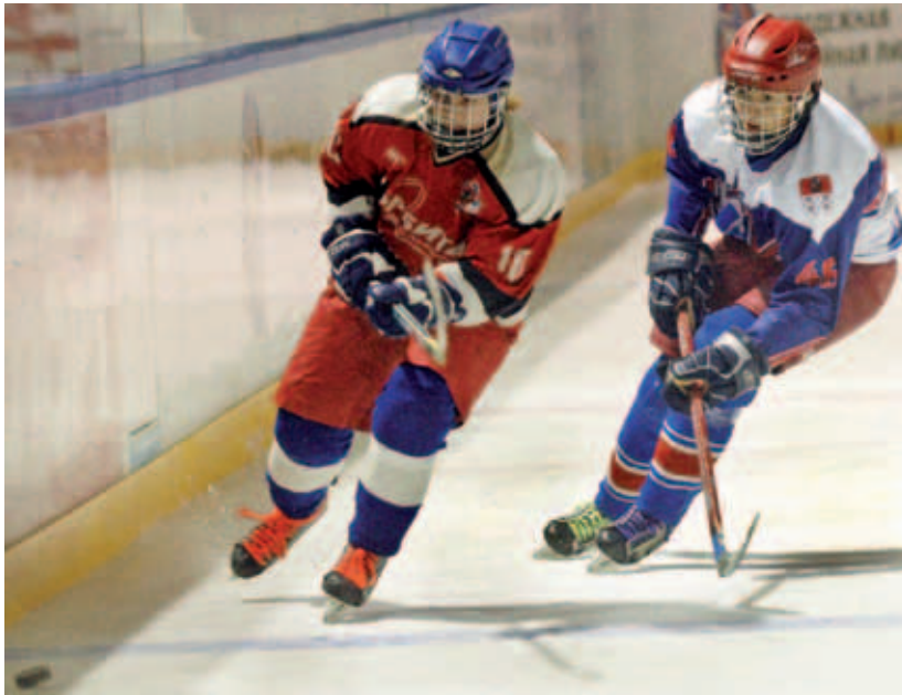
В СЕНТЯБРЕ СТАРТОВАЛ ОТКРЫТЫЙ ЧЕМПИОНАТ МОСКВЫ, А В ОКТЯБРЕ – КУБОК МЭРА ПО ХОККЕЮ СРЕДИ ДЮСШ И СДЮШОР. ВТОРОЙ ГОД В СОРЕВНОВАНИЯХ ПРИНИМАЮТ УЧАСТИЕ ЮНЫЕ ДМИТРОВСКИЕ ХОККЕЙСТЫ.