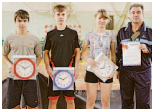
Команда Яхромской школы № 2.