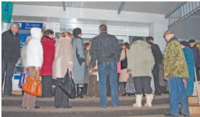
16 ноября 6.00 утра. У входа в ДГБ.

желающие пройти флюорографию, они образовали отдельную очередь. Потому что там как был бардак, так и есть.