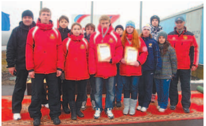
Команда СДЮСШОР «Парамоново».

С 7 по 12 декабря на трассе в Парамонове впервые пройдут этапы Кубка мира по санному спорту среди юниоров. Программа соревнований включает в себя дни предстартовой подготовки с 7 по 9 декабря, соревновательные заезды — с 10 по 12 декабря. А в преддверии соревнований с 30 ноября по 7 декабря состоится интернациональная тренировочная неделя.