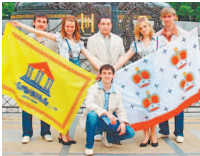
«Дмитровский альянс», 2008 год.

– Когда я играл в «Дмитровском альянсе», КВН был для меня всем. Мы прогуливали студенческие пары, и в это время писали материал к игре. Сейчас КВН для меня – такое сладкое воспоминание вперемешку с горьким чувством утраты. КВН подарил мне много друзей и огромное количество ярких эмоций. КВН – это жизнь.