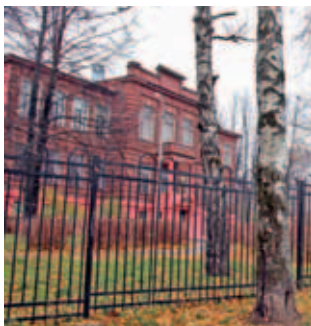
Дмитровская школа № 5.

В соответствии с решением Дмитровского городского суда администрация Дмитровского муниципального района обязана обеспечить финансирование организационно-хозяйственных мероприятий по установлению ограждения по всему периметру земельных участков Мельчевской и Костинской основных общеобразовательных школ высотой 1,5 метра в срок не позднее 1 апреля 2011 года. Управление образования администрации Дмитровского муниципального образования обязано обеспечить выполнение организационно-хозяйственных мероприятий по установлению ограждений по периметру земельных участков этих двух школ в срок не позднее 1 июля 2011 года.