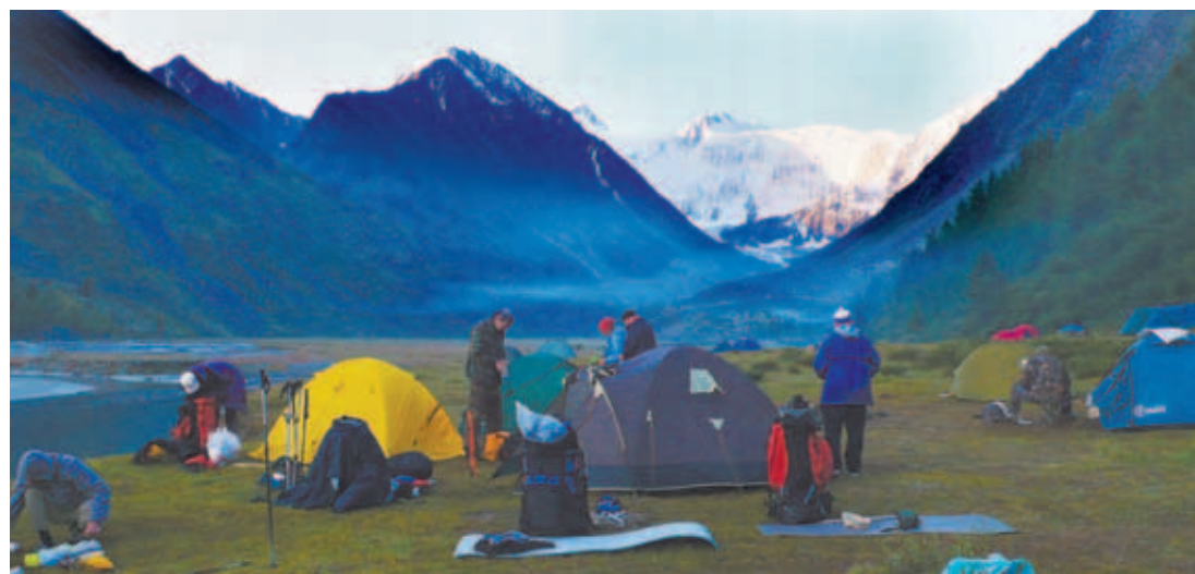
Стоянка на Ак-Кемском озере под Белуху.