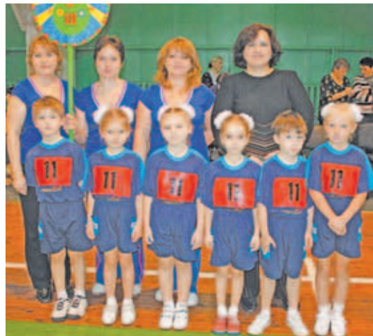
Команда детского сада № 11 «Радость».

Не менее интересно прошли соревнования среди учащихся начальных классов. И здесь в который раз лучшими стали ребята из Дмитровской школы № 9, в очередной раз доказав, что на сегодня они, безусловно, лучшие. На втором месте – Дмитровская школа № 10, на третьем – Дмитровская школа № 5.