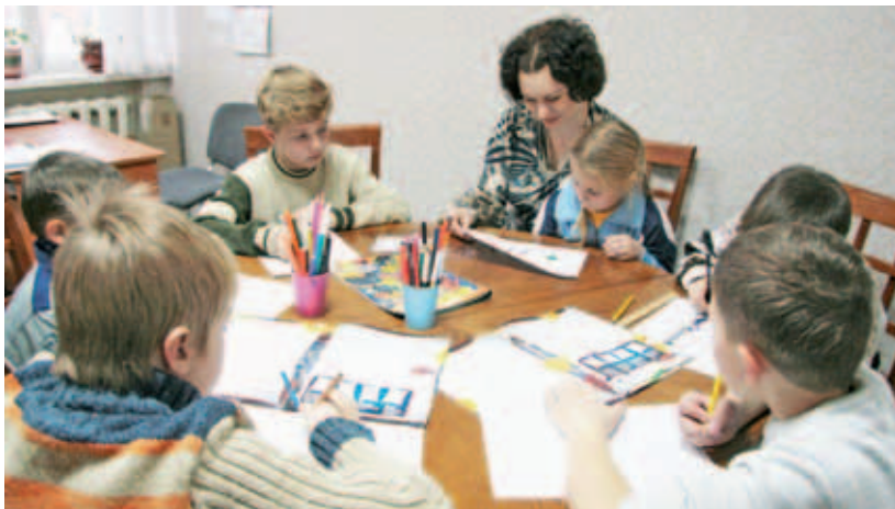
В центре социальной помощи семье и детям.