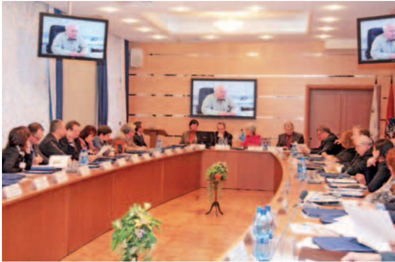
Деловой совет в СВАО Москвы.

А основная часть делового совета началась с того, что префект