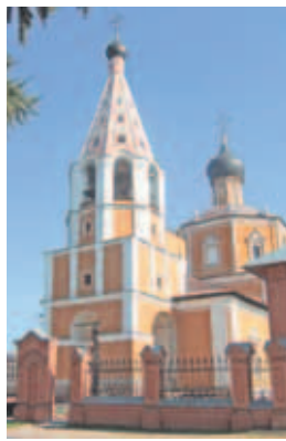
Свято-Николаевский храм в Озерках.

10 декабря, четверг – Иконы Божией Матери, именуемой «Знамение». Великомученика Иакова Персянина. Обретение мощей блаженного князя Новгородского Всеволода, во Святом Крещении Гавриила, Псковского чудотворца. Блаженного Андрея Симбирского. Преподобномучеников монахов 17-ти в Индии (IV).