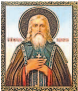
в архимандрита Троицко-Сергиева монастыря.