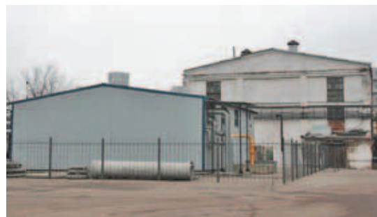
Новая котельная завода «Калибр».