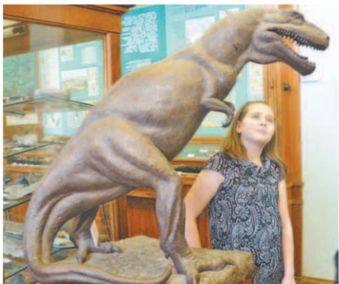
Ученица школы № 10 на экскурсии в Музее землеведения.

Л. Б. КУЗНЕЦОВА, учитель русского языка и литературы школы № 10.