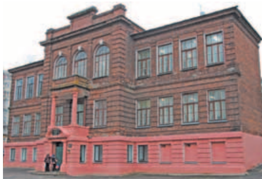
Дмитровская начальная школа № 5.

Директора школ, где ситуация с отстающими учениками серьёзная, давали объяснения, докладывали о проводимых мероприятиях, направленных на исправление ситуации.