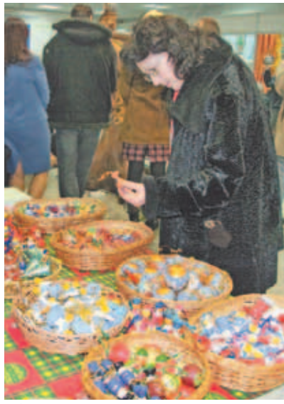
Выжигание и роспись по дереву в традициях народных художественных промыслов города Сергиева Посада.