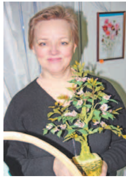
На выставке были представлены работы детей и руководителей кружков ДК «Икша», «Строитель» (Трудовая), «Останкино», «Ермолино»