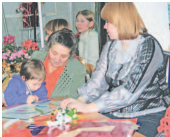
Мастер-класс по изготовлению плёночных витражей. Художественная мастерская «Радужный витраж».

В канун Нового года в Дмитровской межрайонной торгово-промышленной палате прошла выставка работ местных мастеров-умельцев «Зимняя сказка». Увидеть здесь можно самые различные панно, изделия из бисера, кожи, вышивку лентами, плетёные корзины, лоскутные одеяла, гобелены, сувениры из дерева и не только. Для самых смелых гостей были проведены мастер-классы.