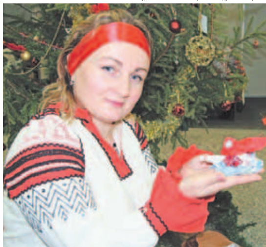
Тряпичные куклы своими руками, ДК «Икша».