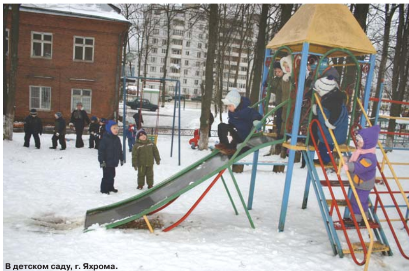
В детском саду, г. Яхромы.

– Любая реформа – потрясение, если её проводят люди без головы. Не к любой цели нужно идти напролом. Не всегда такой путь бывает наиболее быстрым и верным. Я считаю, что любая реформа должна проводиться так, чтобы это вызвало минимум обеспокоенности у жителей поселения. Можно, конечно, строить амбициозные планы, но всегда нужно думать: чем это обернётся для населения? Главное для человека, что он выходит из дома и не попадает в лужу; приходит в магазин, а там есть продукты, которые он в состоянии купить; у него из крана течёт нормальная вода... То есть главное – нормаль-