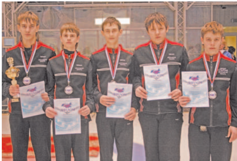
Воспитанники СДЮСШОР г. Дмитрова.

ДМИТРОВ СТАЛ МЕСТОМ ПРОВЕДЕНИЯ ФИНАЛЬНЫХ СОРЕВНОВАНИЙ ПО КЁРЛИНГУ В РАМКАХ IV ЗИМНЕЙ СПАРТАКИАДЫ УЧАЩИХСЯ РОССИИ