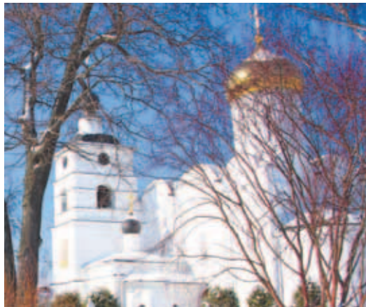
Храм преподобного Алексия человека Божия, приписанного к Борисоглебскому монастырю.

30 апреля, пятница – Память преподобных Зосимы, игумена Соловецкого, Александра Свирского.