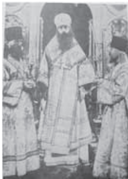
Богослужение епископа Серафима в Успенском соборе г. Дмитрова. Слева сичч. Аристарх (Заглотин-Кокорев), впоследствии иеромонах Николо-Пешношского монастыря.

Преподобномученик Аристарх (Заглотин-Кокорев) – 14 ноября ст.ст. / 27 ноября н.ст.