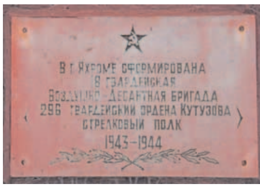
Памятная доска на здании Яхромской администрации.

Данная операция была блестяще осуществлена войсками 2 Украинского фронта, в числе которых был и 37 гв. воздушно-