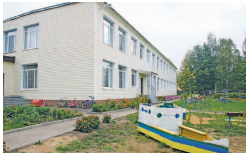
Детский сад в п. Новое Гришино.

Ведётся индивидуальное жилищное строительство, под которое выделено 57 участков, 37 домов сданы в эксплуата-