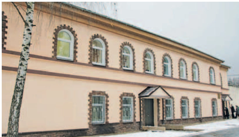
Клуб в п. Новое Гришино.