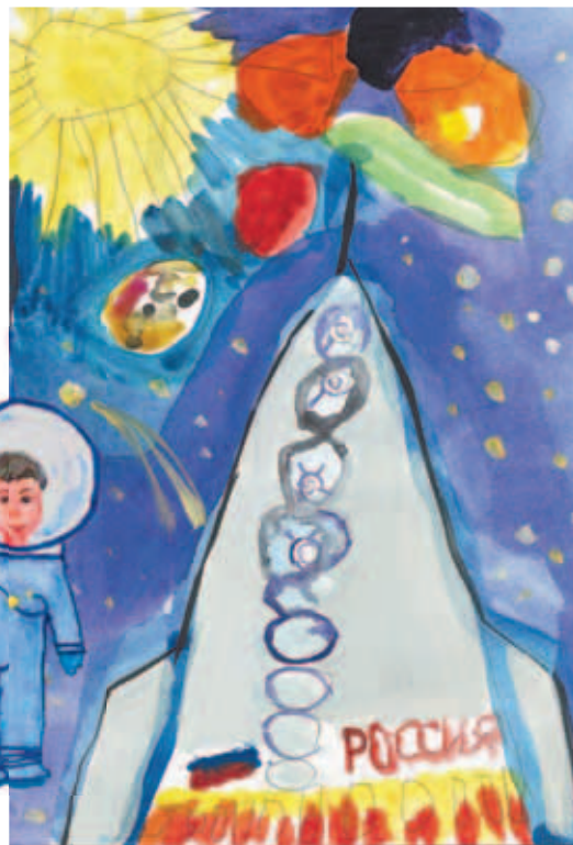
Рис. Никиты ПОТАПОВА.

Со временем человек вышел и в открытый космос. Первый выход в космос был совершён советским космонавтом Алексеем Архиповичем Леоновым 18 марта 1965 года с борта космического корабля «Восход-2» с использованием гибкой шлюзовой камеры. Скафандр «Беркут», использовавшийся для первого выхода, был вентиляционного типа и расходовал около 30 литров кислорода в минуту при общем запасе в 1666 литров, рассчитанном на 30 минут пребывания космонавта в открытом космосе. Из-за разности давлений скафандр раздувался и сильно мешал