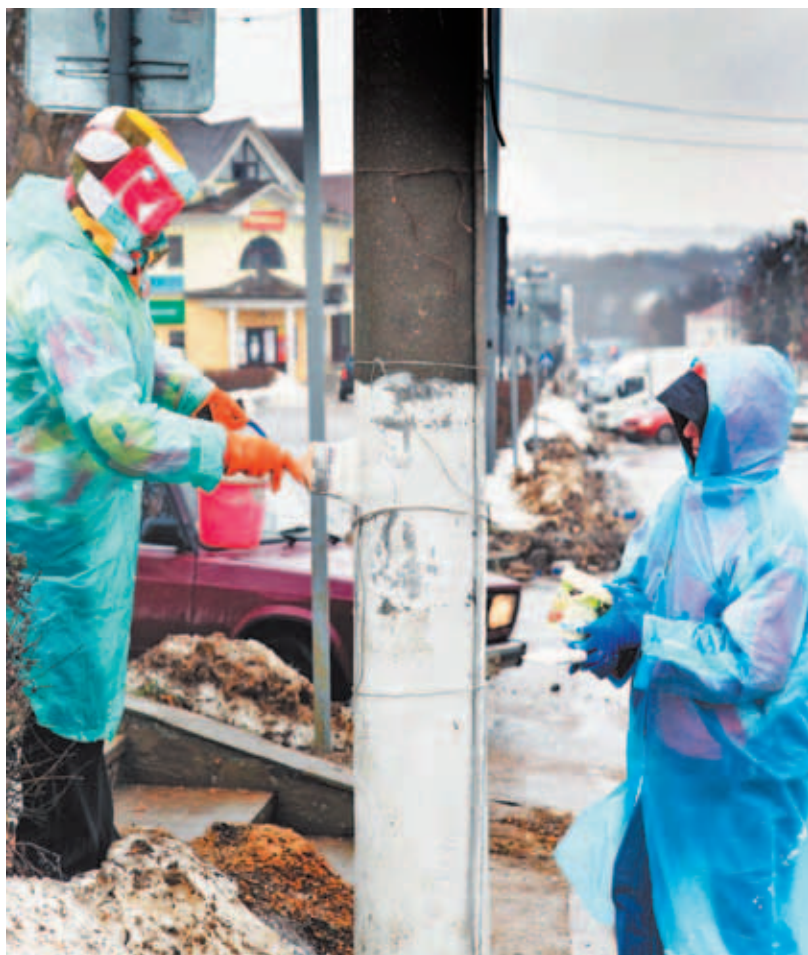
Покраска столбов на ул. Загорской.