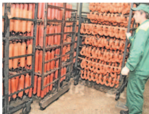
На ООО «Озерские колбасы».

Далее участники совещания узнали, как обстоят дела на Дмитровском мясоперерабатывающем комбинате, с недавних пор выпускающего продукцию под маркой «Дымов». У торговых организаций основной претензией к этому предприятию стала очень высокая закупочная цена, низкое качество и то, что