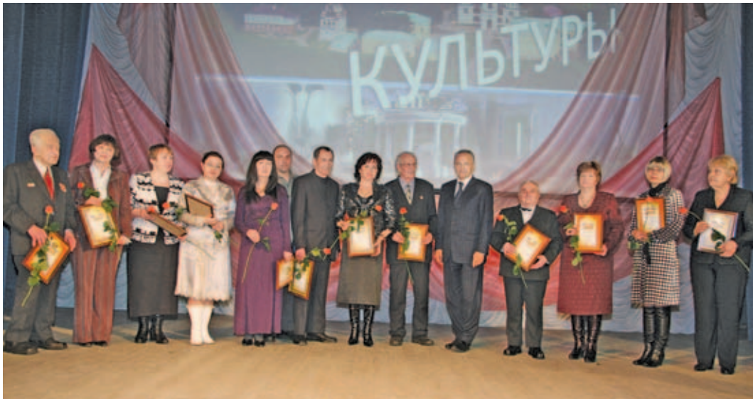
Номинанты премии «Признание».