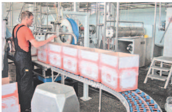
На Дмитровской маргариновой фабрике.

Ещё одно совещание состоялось в ДК посёлка Икша, следующее пройдёт в Яхrome.