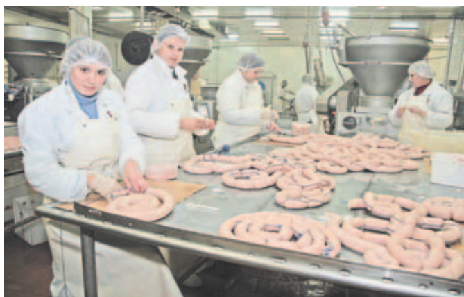
Производство ООО «Дымов».