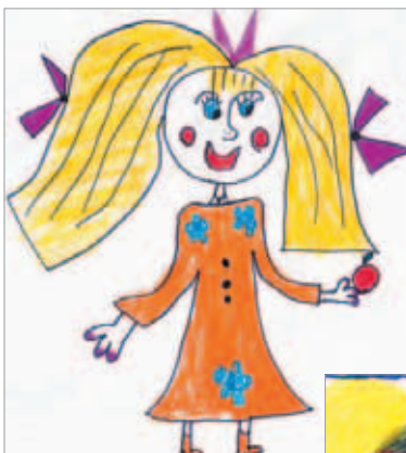
Юля КОТЕНКОВА, 5 лет.