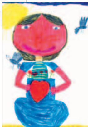
Мария НОВОКРЕЩЕНОВА, 6 лет.