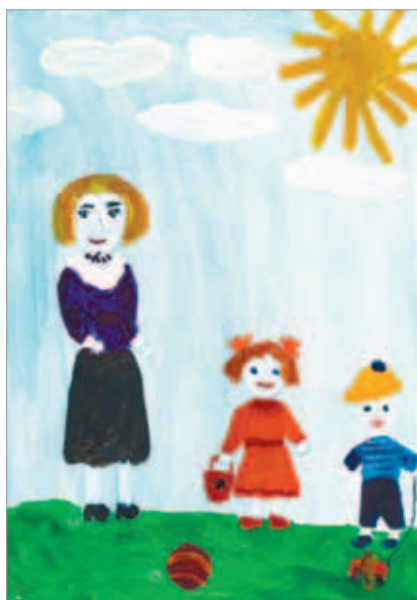
Маша ГАБЛИНА, 7 лет.