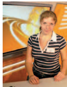
В студии новостей.

Мы и не заметили, как настало время подводить итоги. Ведь нам ещё предстоит собраться всем вместе в Питере на втором этапе семинара. Кто-то говорил, с кем из известных журналистов хотелось бы встретиться, кто-то о том, что неплохо было бы «сделать налёт» на редакцию какой-нибудь газеты. Но каждый, когда брал микрофон, сожалел о том, что мы мало общались.