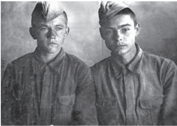
Василий Зайцев (справа) с другом, 1941 год.