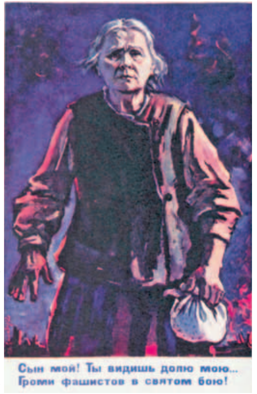
Сын мой! Ты видишь доплю мою... Громил фашистов в святом бою!