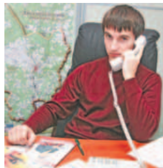
В Бизнес-инкубаторе ДМТПП.

Заключительной частью Дня предпринимателя станет конкурс бизнес-планов. Молодые участники конкурса поделятся своими идеями, а опытное жюри назовёт победителя. Все идеи будут представлены в Интернете на сайте Бизнес-инкубатора ДМТПП.