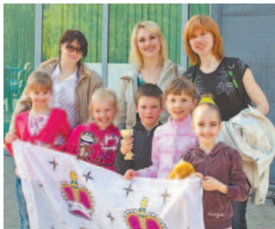
Дмитровские фигуристы с родителями.