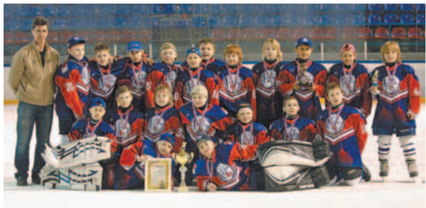
Команда ДЮСШ «Крылья Советов» (Дмитров) 2001 года рождения.

Однако, на домашнем турнире всё же важно было посмотреть