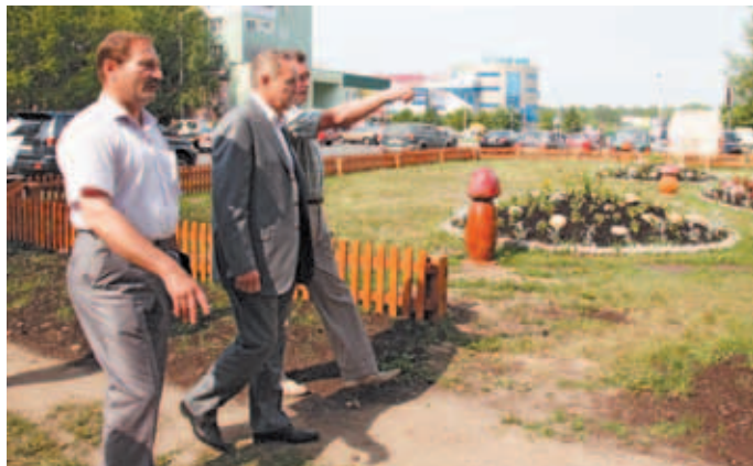
«Грибная поляна» в мкр. им. Аверьянова.