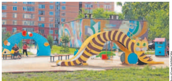
Детская площадка в мкр. им. Аверьянова около домов №№ 3, 5.