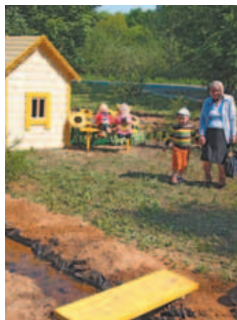
Детская площадка в мкр. Космонавтов около домов №№ 37, 41.