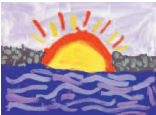
Рисунок ученика школы №5.

Закрашивая нарисованный предмет краской, подсказываю детям, что краска не должна выходить за пределы контура. То же самое касается и закрашивания предмета карандашом. Некоторым детям сложно добиться аккуратности в закрашивании, но терпение и ваша поддержка обязательно дадут нужный результат. В заключение хочу напомнить родителям, что только в детстве душа ребёнка открыта для восприятия чуда. Поэтому нужно постараться построить образовательно и воспитательную работу так, чтобы развить у новой открывающейся личности творческое мировосприятие и умение видеть и творить прекрасное. А уже дальше работа продолжится в общеобразовательной школе, а при желании и способностях — в художественной.