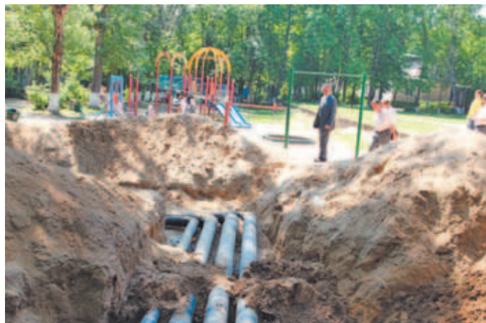
Детская площадка в мкр. Космонавтов около домов №№ 15, 19.