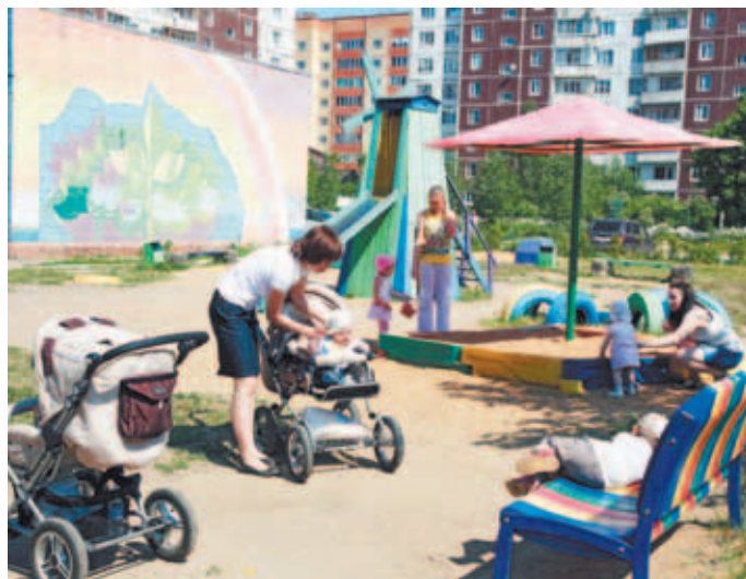
Детская площадка в мкр. им. Махалина около домов №№ 3, 5.