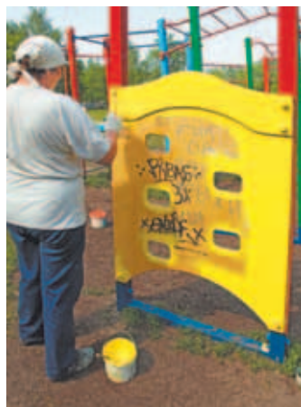
Детская площадка «Сказка» в мкр. им. Маркова.