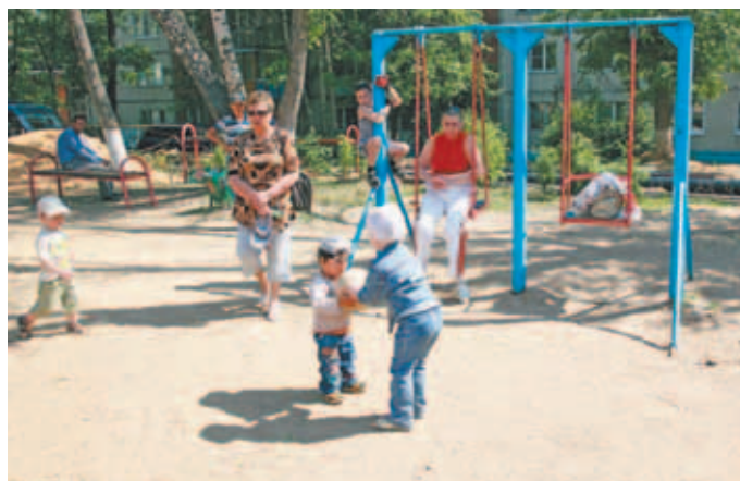
Детская площадка в мкр. Космонавтов около домов №№ 15, 19.

Также в июне будут приведены в порядок все придомовые территории: дороги будут заасфальтированы, в каждом микрорайоне появятся новые спортивные площадки, где физической культурой смогут заниматься как малыши, так и подростки и взрослые, а в подвалах и подъездах домов будут проведены ремонтные работы.