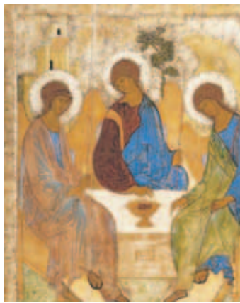
Детям о святых

15 июня весь православный мир праздновал День Святой Троицы. Что же мы знаем об этой иконе?