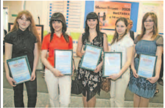
Победители конкурса бизнес-проектов.