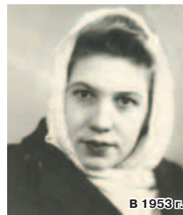
В 1953 г.