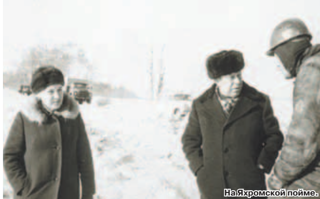
На Яхромской пойме.

Иногда хочется вернуться, пройтись по изученным тропинкам, посмотреть на наш участок... Но страшно потерять добрые детские воспоминания, ведь там сейчас всё по-другому.