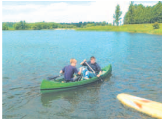
На новом пляже