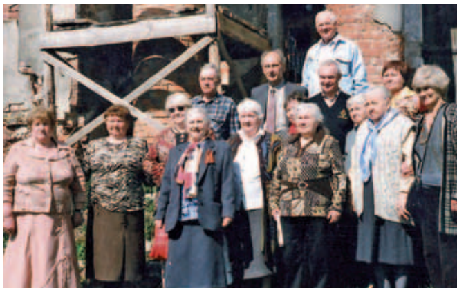
В селе Вороново, 2010 г.

Среди нас, бывших учеников Вороновской школы, немало тех, кто работал на благо Родины от 38 до 52 лет: водителями, ткачихами, шлифовальщицами, литей-