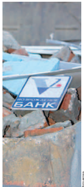
На месте взрыва банкомата у ДГБ, 7 июня.

Результатом заседания АТК стало решение, согласно которому банкам рекомендовано максимально быстро перенести банкоматы из жилых домов в иные места. Отныне в районе категорически запрещена установка новых банкоматов в домах; банки обязуют оборудовать все банкоматы средствами охранной сигнализации с выводом её на пульт ОВО; все новые установки банкоматов будут согласовываться с местной полицией. В ближайшее время состоится обследование всех банкоматов на предмет выявления среди них наиболее незащищённых от посягательств извне, также оценят их на предмет безопасности, с точки зрения пребывания рядом с ними большого числа людей.