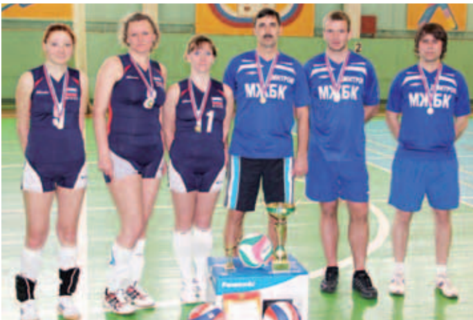
Победители турнира — команда «Созвездие».