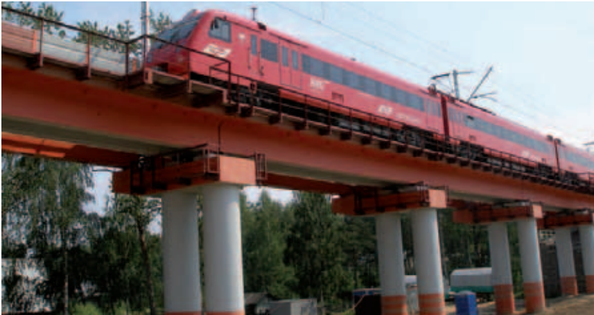
Мост в Шереметьево.

ФОО «ДМИТРОВСКИЙ ЗАВОД МОСТОВЫХ ЖЕЛЕЗОБЕТОННЫХ КОНСТРУКЦИЙ» (МЖБК) ХОРОШО ИЗВЕСТЕН В НАШЕМ РАЙОНЕ КАК СОВРЕМЕННОЕ ТЕХНИЧЕСКИ ОСНАЩЕННОЕ ПРОИЗВОДСТВО, НА КОТОРОМ РАБОТАЮТ КВАЛИФИЦИРОВАННЫЕ СПЕЦИАЛИСТЫ И РАБОЧИЕ.