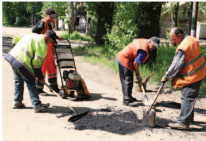
Ямочный ремонт в селе Куликово.

Но с нашей стороны, уважаемые жители поселения, тоже необходимы позитивные шаги. Сегодня жизнь требует создавать территориальные общественные советы, люди должны сами участвовать в местном самоуправлении. Только общими усилиями можно навести порядок.