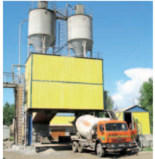
Новый бетоносмесительный узел.