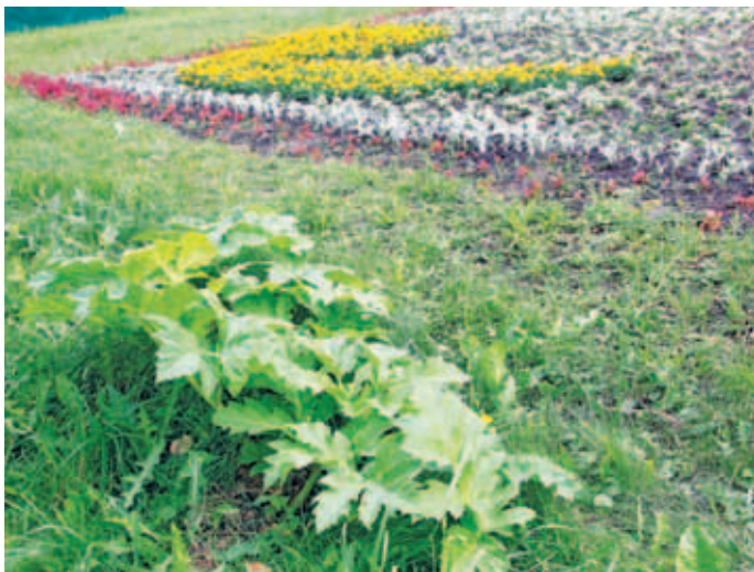
Снимок сделан 4 июля 2011 г.