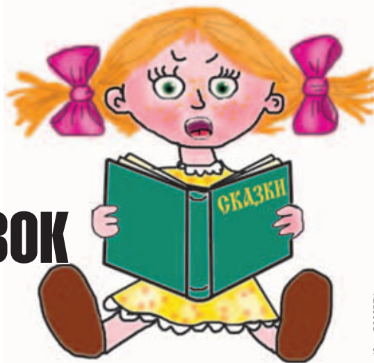
Рис. Юлия Досореева

Похожий момент отсутствия родительской бдительности описан в сказке «Красная Шапочка». Кто виноват в той жуткой истории, которая произошла с бедной девочкой – сама Красная