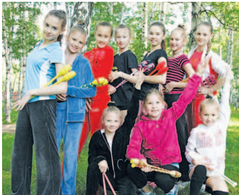
Лучшие дмитровские гимнастки на сборах.