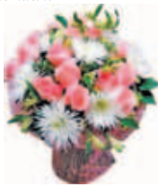
Сын, сноха, внуки.

От всей души, с большим волнением, С которым, слов не находя, Мы поздравляем с днём рождения, С 80-летием тебя! Наш родной юбиляр, Не болей, не старей, Не грусти, не скучай И ещё много лет Дни рождения встречай!