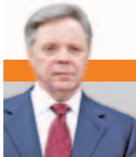
Борис ГРОМОВ, губернатор Московской области

ОБЛАСТЬ СТРЕМИТСЯ КО ВТОРОМУ ПО ВЕЛИЧИНЕ БЮДЖЕТУ В СТРАНЕ