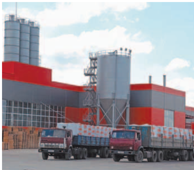
Дмитровский завод газобетонных изделий.

Выскажите своё мнение на сайте www.infodmitrov.ru