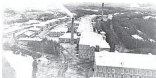
Покровская мануфактура. Начало XX века.

На следующий день был заключительный конкурс «Полоса препятствий». От него зависело место на турслёте. «Бродяги» справились отлично и заняли 1 место.