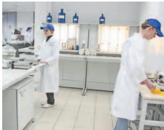
В лаборатории Дмитровского молочного завода.

За качеством продукции тщательно следят в заводской лаборатории, которая оснащена новейшим оборудованием и работает круглосуточно. Руководство завода планирует создать на своей базе межотраслевую лабораторию областного уровня. И это лишь малая часть из того, что намечено.