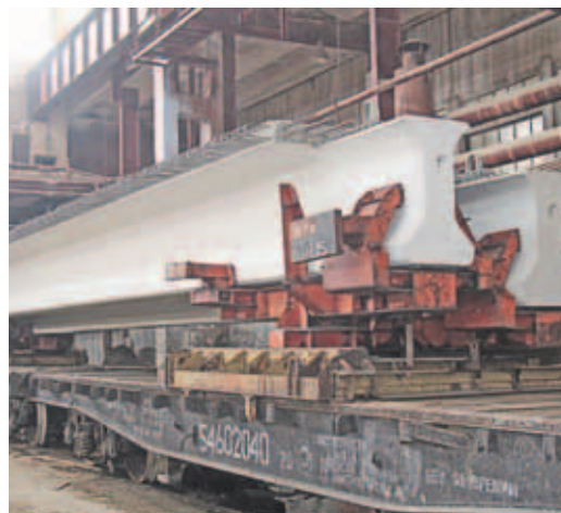
В цехе Дмитровского завода МЖБК.

В настоящее время предприятие располагает производственными мощностями для выпуска 64 тыс. м 3 железобетона и 300 тыс. м 3 нерудных строительных материалов в год. Пока ещё не все мощности завода востребованы. Но коллектив уверен, что с подъёмом экономики и при поддержке транспортных строителей в лице Корпорации «Трансстрой» имеющийся потенциал будет задействован полностью. Завод к этому готов, несмотря на 50-летний возраст.