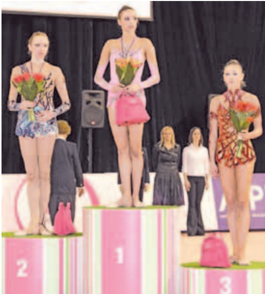
Этап Гран-при, Брно (Чехия), март 2009 г.

Вчера дмитровская команда в Щёлкове провела матч с местным «Спартаком», а 8 июля на стадионе «Локомотив» ПФК «Дмитров» принимает «Текстильщик» (Иваново), начало в 18.00.