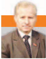
Николай САВЕНКО, министр сельского хозяйства и продовольствия Правительства Московской области

ИНТЕРНЕТ-КОНФЕРЕНЦИЯ МИНИСТРА СЕЛЬСКОГО ХОЗЯЙСТВА И ПРОДОВОЛЬСТВИЯ ПРАВИТЕЛЬСТВА МОСКОВСКОЙ ОБЛАСТИ