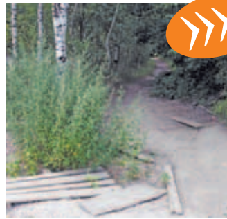
И это – тротуар!

Но ямы на дороге – это только полбеды. Всем известно, что у каждой проезжей части должны быть ещё и тротуары. А вот каким образом жители улицы Спасской добираться до дома пешком, вообще