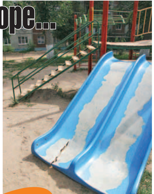
Детская площадка мкр. Космонавтов.

К счастью, в архиве редакции сохранился снимок июньского рейда. Предлагаем сравнить.