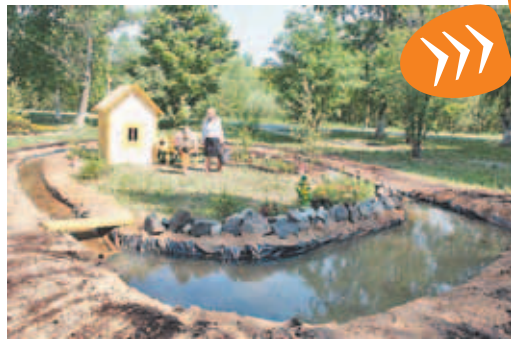
3 июня 2011 г.