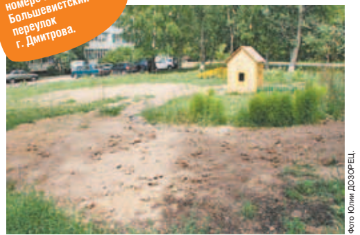
27 июля 2011 г.