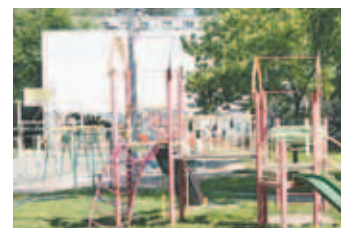
Мкр. им. А. Маркова, площадка у дома № 41.