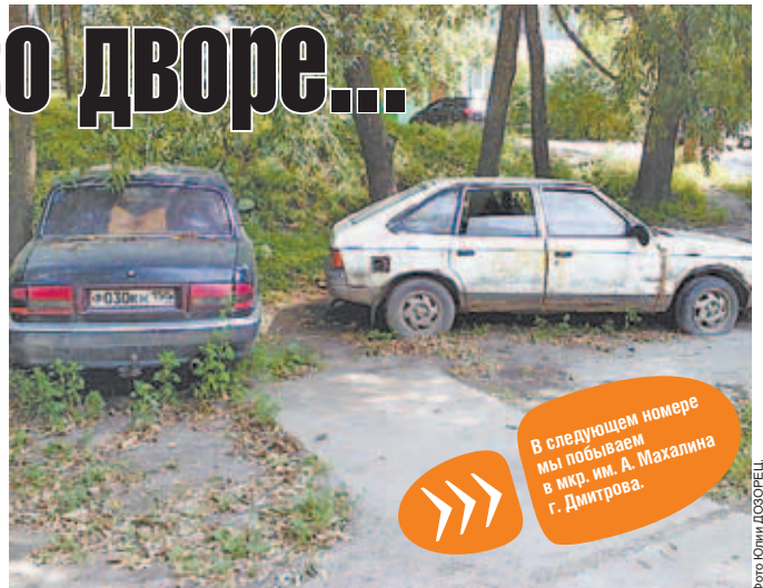
Ул. Подъячева, около домов №№ 5 и 3.

Здравствуй! Через газету обращаюсь к ответственному за благоустройство нашего города. Это крик души: сколько же можно стричь траву, которой почти нет, без травы земля страдает от