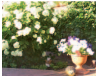
Цветы Л. Беляковой.

Мы ждём писем с фотографиями по адресу: 141800, г. Дмитров, ул. Московская, д. 5 или по электронной почте dmitrovvestnik@mail.ru до 20 августа.