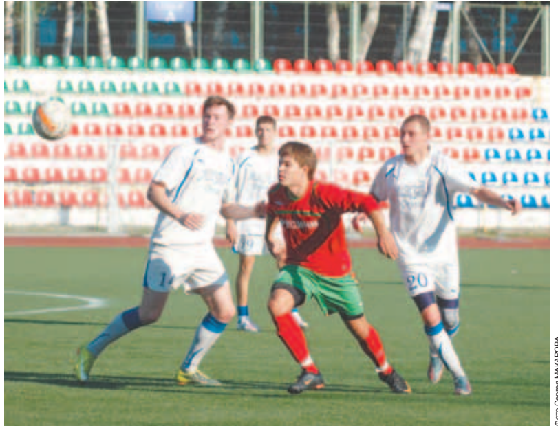
На футбольном поле команды «Аква-Сервис» и «Русичи».