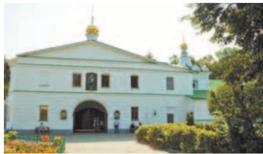
Храм Феодоровской иконы Божией Матери в Борисо-Глебском мужском монастыре.

Придел иконы Божией Матери Владимирская церкви Михаила Архангела с. Белый Раст.